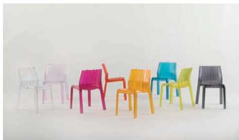
Colección de sillas Friily , editada por Kartell.